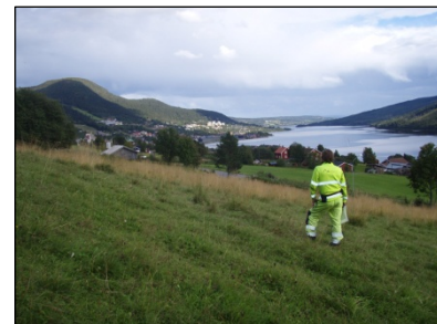
Två av tre nyligen avslutade upp- drag i Jämtland – i Hallens, Åre och Brunflo socknar – har involverat arbete med länets vanligaste forn- lämningar, fångstgropar. Här är en betagande utsikt över Åredalen från Rödkullens planområde.