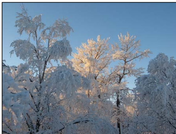
Jämtland på vintern är som ett julkort. Snötyngda och rimfrostiga björkar i Östersund.

Arkeologikumets nyhetsbrev utkommer med ojämna mellanrum sex gånger per år. För att minimera miljöbelastningen är utgåvan på papper ytterst begränsad. Nyhetsbrevet finns dock alltid att läsa på vår hemsida, www.arkeologikum.se .